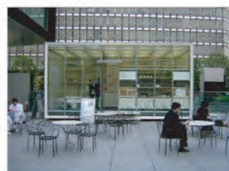
第3のワークプレイス