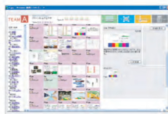
Web協同作業空間ツール