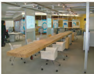
アクティビティを吸収する パufferゾーン