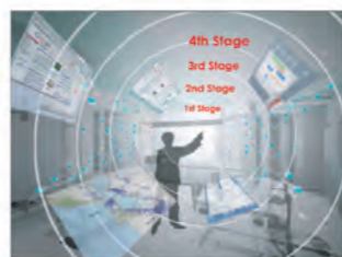
プロセス・成果を資産化するツール