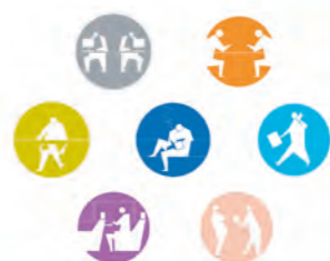
ワークスタイルデザイン

情報通信技術が目覚ましく進展する中で、新世代のオフィス、近未来オフィスのあり方やワークスタイルの変化に関して情報収集した上で、次の時代を予測し、時代に合ったオフィスのあり方を提示する。