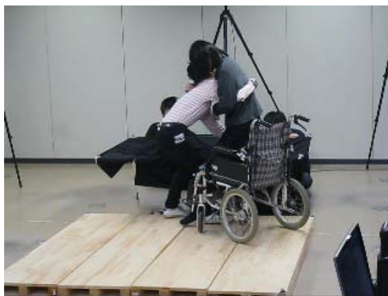
図3 介護士の入浴介助動作の解析の研究