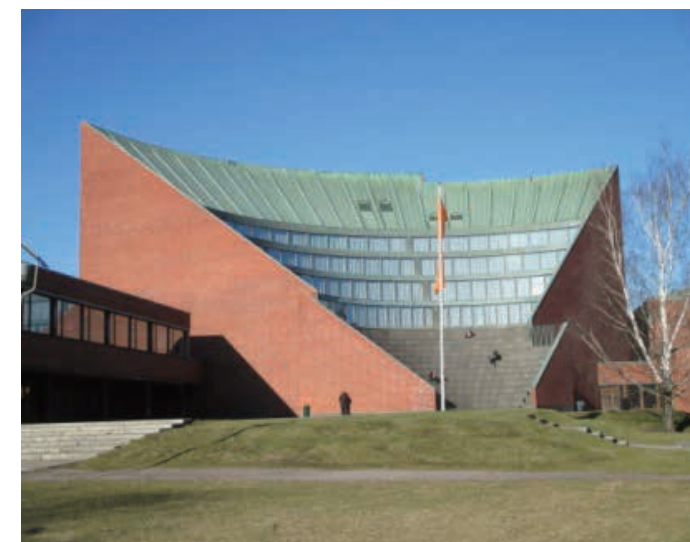
アールト大学オタニエミキャンパス Otaniemi Campus in Aalto University