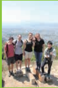
友達と大文字山に登りました Climbing Daimonji with friends

私は建築についての学びを深めながら国際的な視野を広げることを目的として、外国に留学したいと考えていました。私はたくさんの国を旅行し、それらすべての国が留学先としての固有の魅力を持っていることに気づきました。