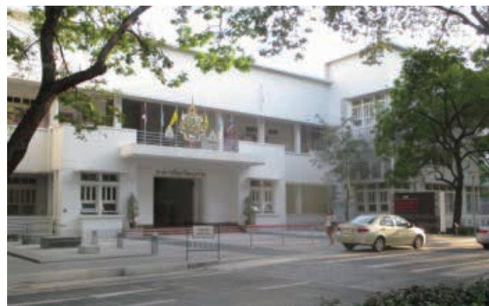
チュラロンコン大学のキャンパス Building in Chulalongkorn University

KIT administrative staff traveled to Thailand, to speak with current Global Internship participants and a KIT alumnus, February 21 through 25, 2015. Five KIT students are now at Silpakorn University in conjunction with the Global Internship Program. KIT staff toured the SU campus facilities, gleaned insights on internships in Thailand from a KIT alumni from Japan who has resided in Thailand for 19 years and discussed information related to the upcoming alumni meeting with our Key Station chairperson, Ms. Saikuwan Trisunan.