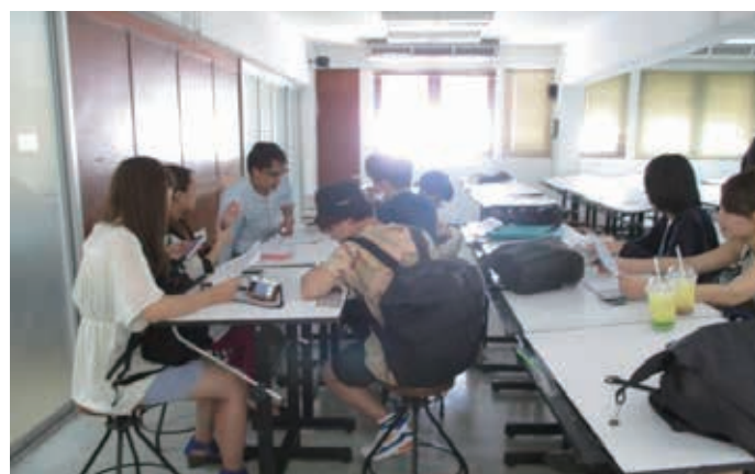
ミーティングの様子 Meeting in Silpakorn University