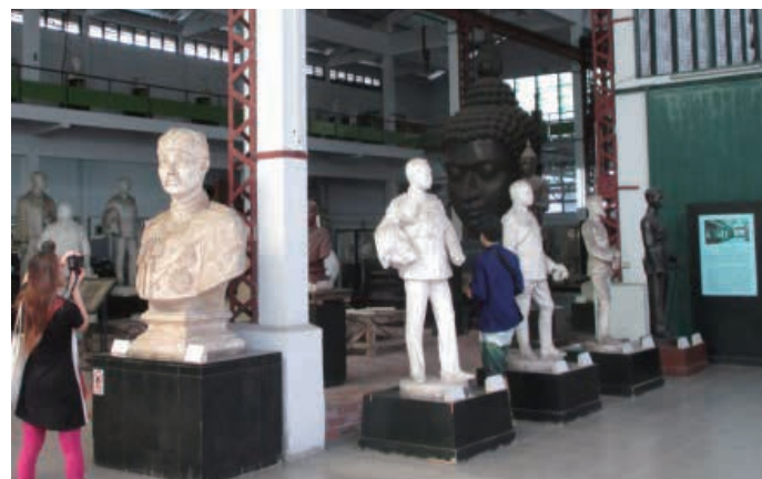
シリバコーン大学内の美術館 Museum in Silpakorn University