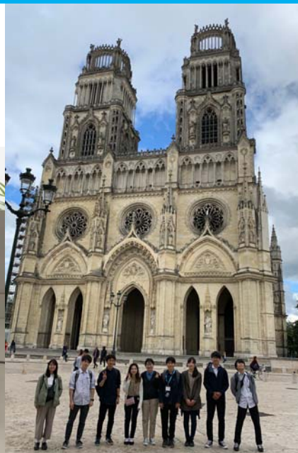
写真メイン：Robotics Competition 最終日のコンテストでは受講者全員が集まり、成果を競い、大変な盛り上がりを見せる。 写真左：Polytech Orléans 写真中央：Robot motion test 写真右：Cathédrale Sainte-Croix d'Orléans

参加者の声 ●オルレアン大学ポリテック・オルレアンの正規授業“Technological Project”に参加し、オルレアン大の学生チームに一人ずつ入って一緒にロボットを製作し、最後にはチーム対抗のロボットコンテストに挑戦しました。●専攻が違いますが、ものづくりの分野は必ずしも無関係とは限らないと考え参加することを決め、結果とても良かったです。●このプログラムはチームワークの構築が軸にあり、プロジェクトマネジメント能力も同時に問われたので、フランスでロボットを学ぶということに大きな意味が合った。●失敗しても盛り上げる、成功したらもっと盛り上がる、そんな彼らの姿をみて、これはいい文化だなと思った。●自分の中にある無意識のうちに作られていた固定観念に気付くことができ、自身の世界が広がった。●言葉が通じない中で相手のことを必死に理解しようとする姿勢や、異なる文化の家庭で生活することは、話で聞く以上の学びがあった。