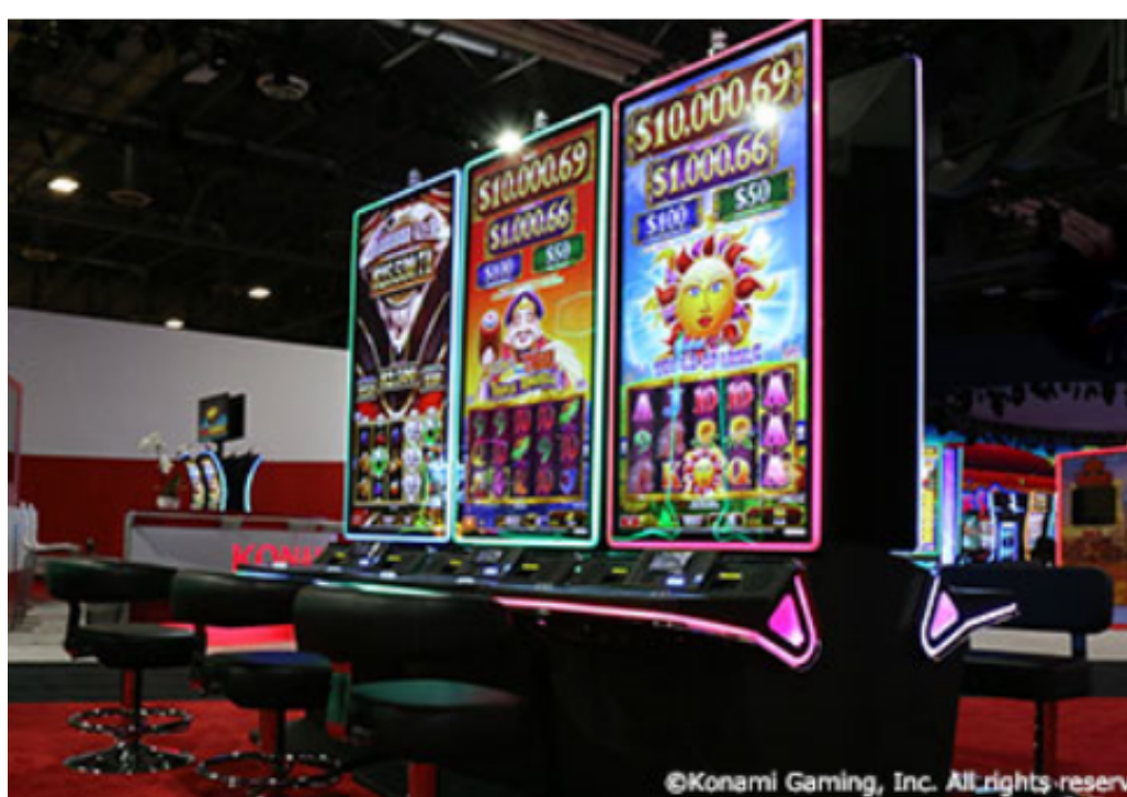
65インチの4KウルトラHDディスプレイを搭載