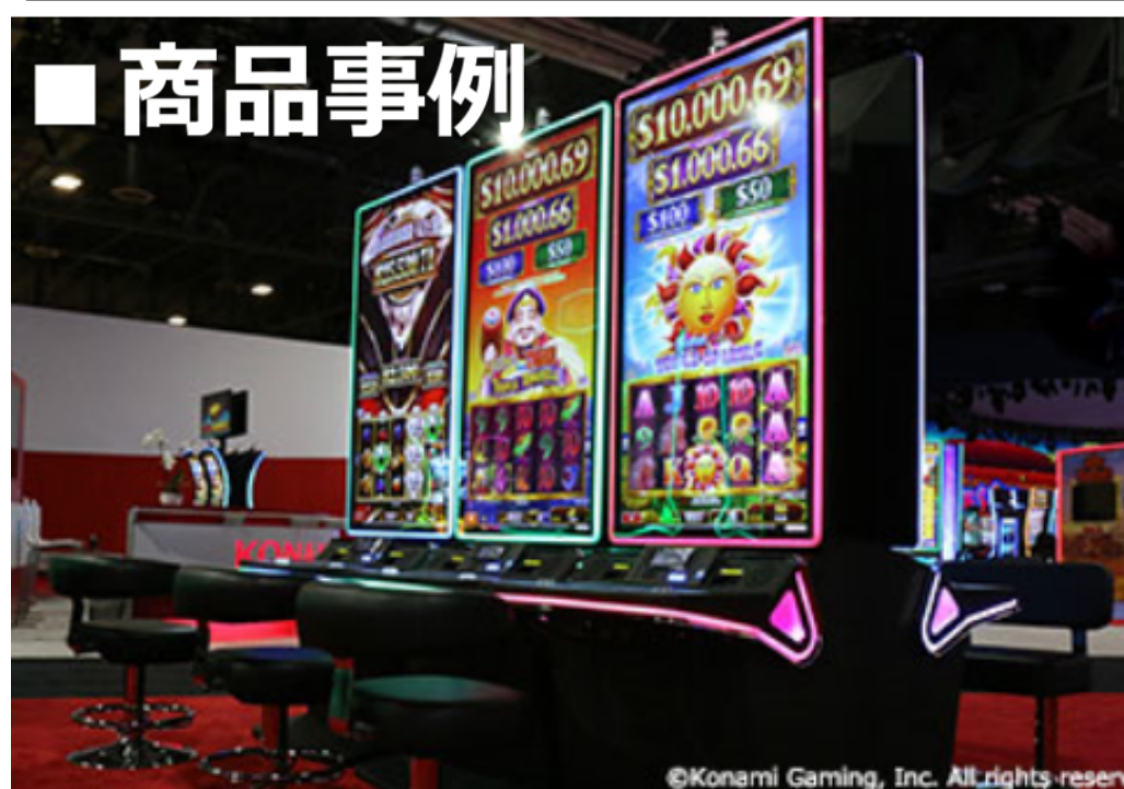
65インチの4KウルトラHDディスプレイを搭載