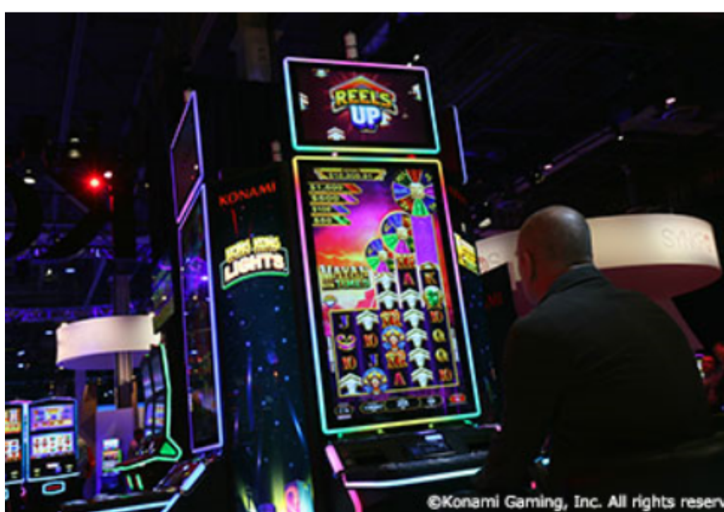
43インチの4KウルトラHDディスプレイとスリム化したデザイン