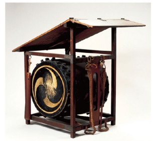
[左上から]ヒルシャー、フベルト《ワルシャワの秋 第14回国際現代音楽フェスティバル 1970年》1970年/エイドリゲヴェイ テュス、スタシス《ボスニアでスペイン音楽を楽しもう》1988年/シフィエジ、ワルデマル《展覧会「世界の音楽から」 1990年/作者不詳《風笙》年代不詳/作者不詳《法螺貝》年代不詳/作者不詳《陣太鼓》年代不詳 [表] 作者不詳《小鼓(薔薇に篠竹蒔絵鼓胴)》江戸時代前期