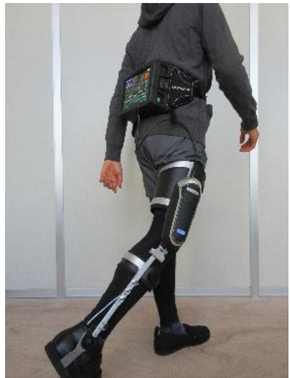
(右) 本機器を KAFO (長下肢装具) に装着した様子