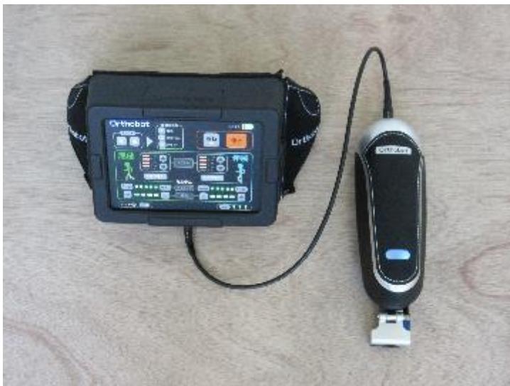
(上) 「Orthobot」本体ユニットと腰ベルトユニット

Orthobot は、歩行に何らかの障害を抱える人々の歩行リハビリテーションを補助する装着型アシストロボットです。従来のリハビリテーションロボットは装着に時間がかかり、専門家による設定が必要であるなど、専門家のいない介護現場では利用が困難でした。本機器はモーターとセンサーを内蔵した本体ユニットを、使用者が歩行リハビリテーションにおいて KAFO (長下肢装具) に取り付けるだけで、装着者の歩行を本来あるべき歩行運動に誘導することができます。本機器を使用することにより、歩行が不安定になった方に対して、簡便に正常な歩行を体験させることが可能になります。