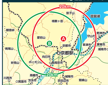
大学から20kmの地図 (●松ヶ崎キャンパス ◎嵯峨キャンパス)

余震がおさまり落ち着いたら、自宅に帰るか検討する。交通機関が動いていない場合は歩いて帰宅することになる。その場合の目安は20km。20kmよりも遠い人は避難場所へ。また、チェーンメールなどに惑わされず、テレビ・ラジオなどで正確な情報を収集しましょう。