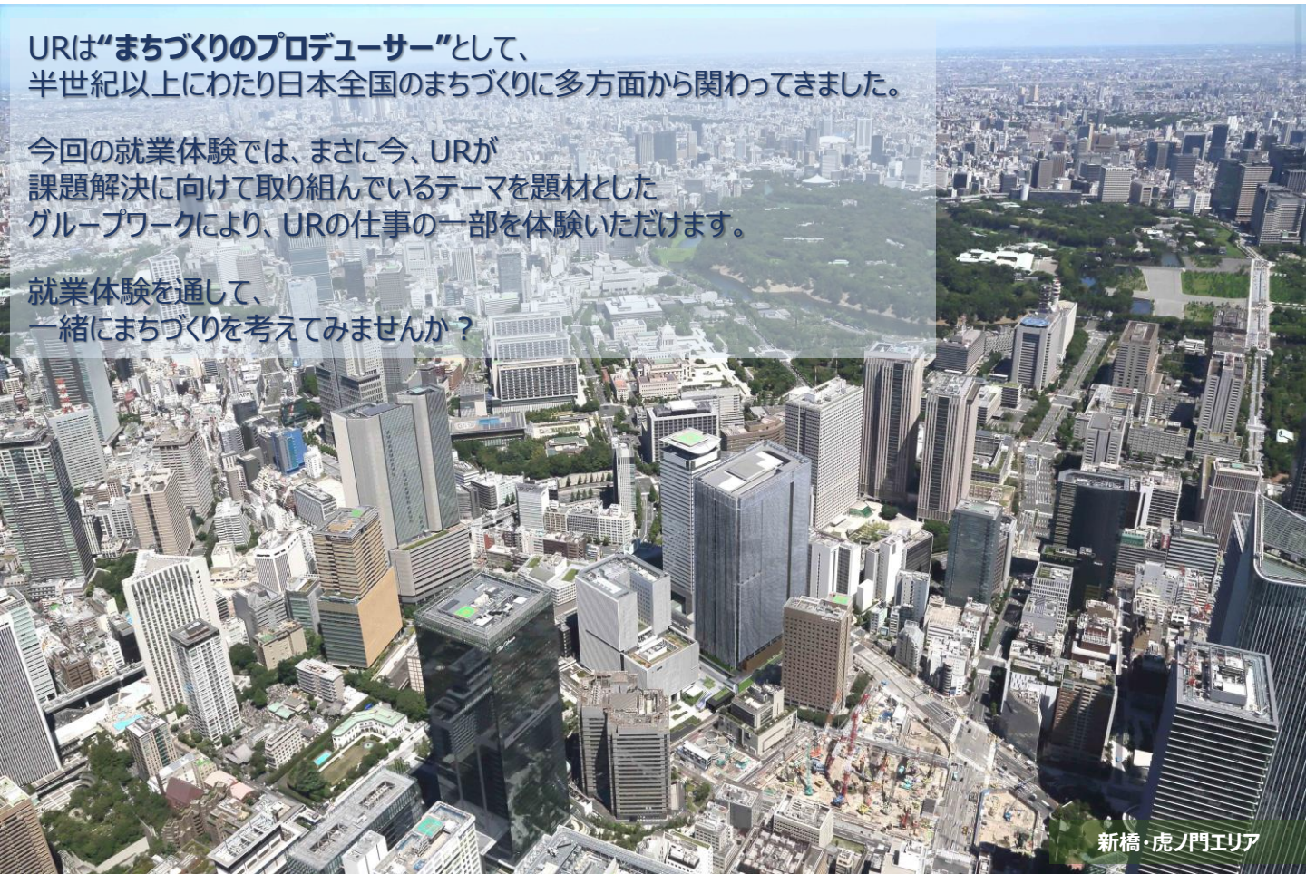
新橋・虎ノ門エリア