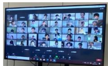
昨年度オンライン就業体験の様子