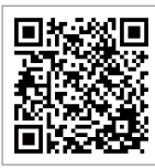
ジョブこねっと 専用申し込み