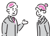
きよか 許可をもらう