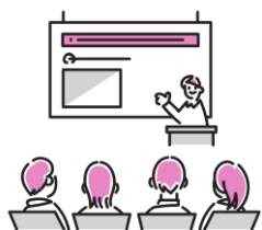
たいめん ていねい しどう 対面による丁寧な指導

ばめん おう ひょうげん きぎょうぶんか せいど ちしき まな さまざまなビジネス場面に応じた表現、企業文化や制度など「はたらくための知識」についても学びます