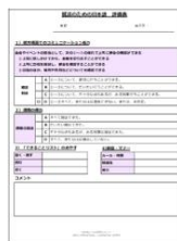
しゅうりようしやう ひょうかひやう 修了証※1、評価表※2

※1 80%以上の出席が必要です ※2 あなたの日本語のレベルを、講師がチェックします