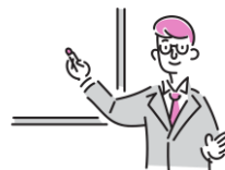
しゃかいほけんせいど 社会保険制度などの講義

ばめん おう ひょうげん きぎょうぶんか せいど ちしき まな さまざまなビジネス場面に応じた表現、企業文化や制度など「はたらくための知識」についても学びます