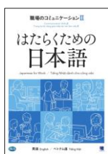
しゅうろう とっか 就労に特化したテキスト