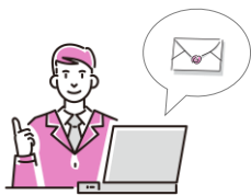
おく メールを送る