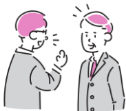
そうだん 相談する