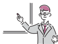
しゃかいほけんせいど こうぎ 社会保険制度などの講義

ばめん おう ひょうげん きぎょうぶんか せいど ちしき まな さまざまなビジネス場面に応じた表現、企業文化や制度など「はたらくための知識」についても学びます