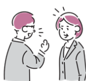
かんけつ ほうこく 簡潔に報告する