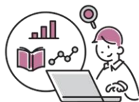
けんしゅう 研修のレポートをかく