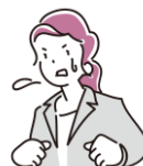
たいおう トラブルに対応する