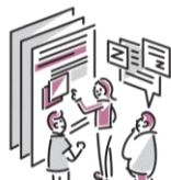
げんじよう もんだい かいぜん かんが 現状の問題の改善を考える