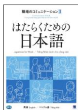
しゅうろう とっか 就労に特化したテキスト