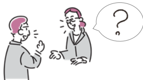
しじ ふめていん かくにん 指示の不明点を確認する