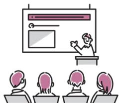
たいめん ていねい しどう 対面による丁寧な指導

ばめん おう ひょうげん きぎょうぶんか せいど ちしき まな さまざまなビジネス場面に応じた表現、企業文化や制度など「はたらくための知識」についても学びます